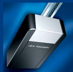
tousek napędy do bram garażowych szybkie i oszczędne