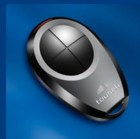
tousek program nadajników impulsów kompatybilne i niezawodne