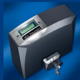
tousek napędy do bram przesuwnych kompaktowe i niezawodne