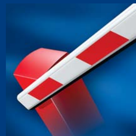
tousek szlabany drogowe atrakcyjne i niezawodne

Zastrzegamy sobie prawo do zmian; za ewentualne błędy w druku nie ponosimy odpowiedzialności.